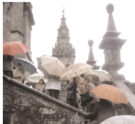
VISITA ÁS CUBERTAS DA CATEDRAL

Aparte destas novidades tamén cabe destacar o éxito, un ano máis, das clases de internet e informática.